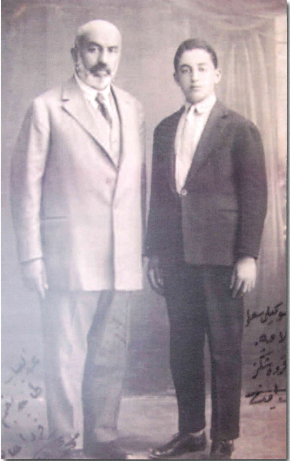
Mehmet Âkif ve oğlu Emin