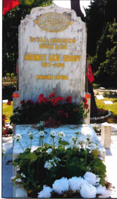
Mehmet Âkif'in Kabri

diyen millî şâirimiz gurbette ölümün kendisi için çok ağır olduğunu düşünmüş ve 17 Ağustos 1936'da İstanbul'a gelmiştir. Âkif 20 gün hastanede kaldıktan sonra, kendisi için hazırlanan dâireye yerleştirilir. Prens Halim'in daveti üzerine bir müddet Alemdağ'daki Baltacı Çiftliği'nde kalır. Hastalığı gittikçe artan Âkif, tekrar kendisi için hazırlanan dâireye geri döner ve 27 Aralık 1936 tarihinde vefat eder. Cenâzesi Beyazıt Camii'nden üniversite gençliğinin katıldığı büyük bir cemaat tarafından Edirnekapı Mezarlığı'na kaldırılır. 1960 yılında yol çalışmaları sebebiyle kabri Edirnekapı Şehitliği'ne taşınır. 1986 yılında Kültür Bakanlığı tarafından mezar taşları düzenlenerek üzerine yeni bir lâhit yapılmıştır.