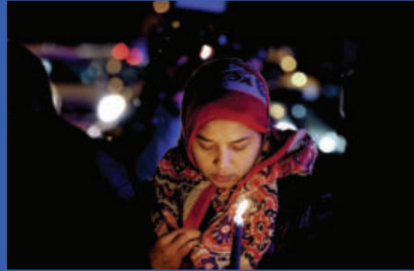
Candlelight walk protesting the Muslim Ban in Washington, D.C.

Featuring an Updated National American Islamophobia Index