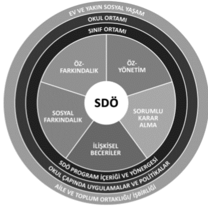
Şekil 2.1. Temel Casel Yeterlilikleri (Casel, 2019)