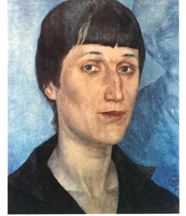
Anna Akhmatova'nın 1922'de Petrov-Vodkin tarafından yapılan yağlıboya portresi. Rusya'nın 20. yüzyılda yetiştirdiği en büyük üç lirik şairden biri kabul edilir. Genç yaşında parlamasına karşın, kişisel, içe dönük “burjuva” üslubu yeni rejime ters düştüğünden, 1925 tarihli bir parti kararıyla eserlerini yayımlayamaz hale geldi. 1935-1940 arasında kaleme aldığı başyapıtı Requiem, kendisinin de iki eşini Gulag'a ve gizli polise kurban verdiği Stalin terörünü anlatır.

Bu gibi varoluş bunalımlarının mutlu sonu olamaz. Olmadı da. Birçoğu kaçtı ve bir daha geri dönmedi: Kandinsky, Stravinsky, Horowitz, Balanchine, Nijinsky, Diaghilev, Chagall, Gabo...