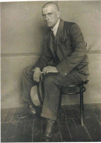
Olanca karizmasıyla Mayakovsky. İlk büyük şiirine On Üçüncü Havari başlığını koydu; Çarlık sansürü nedeniyle Pantolonlu Bulut 'a çevirdi. Fırtınalı enerjisi ve çılgın aşklarıyla kendini zapturapt altına alma çabalarını bir buluta pantolon giydirmeye benzetiyordu. Devrime dört elle sarıldı; propaganda afişleri çizdi, basit slogan dörtlükleri yazdı. Partiye hizmet ile "boğazına takılan ajitprop" arasında gitti geldi. 1930'da intihar etti.

Nureyev, Baryshnikov, Valery Panov ve Galina Panova ile 20. yüzyıl sonlarına dayanan, saymakla bitmeyecek bir göçmen ve sığınmacı dizisi. Diğer bazılarını, örneğin Vsevolod Meyerhold, Osip Mandelstam ve Isaac Babel'leri, Bukharin'in (maalesef ancak sıra kendisine geldiğinde) "cehennem makinesi" diye nitelediği aygıt katletti. Anna Akhmatova bütün ailesini yitirdi. Pasternak ve Bulgakov ezildi, sindirildi. Shostakovich kâh övülme kâh yerilmenin şizofrenisini bir yanda senfonilerine diğer yanda kuartetlerine yansıttı. Muhtemelen NKVD'nin dozajı giderek artan takip ve tacizinin depresyona ittiği, henüz otuzundaki Yesenin, 28 Aralık 1925'te intihar ederken arkada kendi kanıyla yazdığı bir "Elveda" şiiri bıraktı. Aynı yıl Mayakovsky New York'a gidip geldi. Memlekete dönüş! başlıklı şiirinde, proleterlerin komünizme aşağıdan ulaşmalarına karşılık, kendisinin yukarıdan, "şiirin semaları"ndan "komünizme daldığını," sanki bir suç işlemişçesine itiraf etti. Entelektüel (yani "burjuva") köklerini bir şekilde telafi etmek uğruna, kendini alabildiğine aşağıladı; parti-devlet mekanizmasında küçük bir vidadan ibaret olmak istediğini dile getirdi: