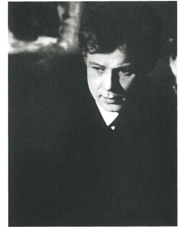
Yesenin'in trajik yaşamı. 1913'te Çarlık gizli polisininin, 1923'ten itibaren de Sovyet gizli polisininin takibine girdi. 1917'de önce Şubat, sonra Ekim devrimlerine kucak açtı. Ama sonra hayal kırıklığına uğradı. 1923'te iki kere, 1924'te dört kere tutuklanıp sorgulandı. 28 Ocak 1925'te St. Petersburg'da, otel odasında ölü bulundu. Kendini astığı söylendi, ama OGPU ajanlarınca öldürüldüğüne dair şüpheler bugüne dek giderilemedi.