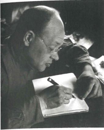
Babel ve not defterleri. Hayatın bütün ayrıntılarına tutkun bir gözlemciydi. Çok yönlü gerçekçiliğiyle Mareşal Budyonny'yi çok kızdıran Kızıl Süvariler , ardından Odessa Hikâyeleri Rus edebiyatının başyapıtları arasına girdi. 15 Mayıs 1939'da dört NKVD ajanı tarafından evinden alınıp götürüldü. 16 Ocak 1940'te Beria, aralarında Babel'in de bulunduğu 346 "parti düşmanı"nın idam listesini Stalin'in önüne koydu. 26 Ocak 1940'ta yirmi dakika yargılandı. 27 Ocak sabahı kurşuna dizildi.