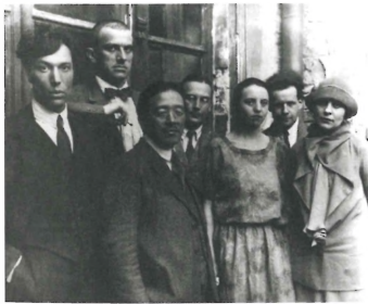
Geçmiş zaman olur ki. 11 Mayıs 1924'te Moskova'da çekilmiş bir grup fotoğrafı. Soldan sağa, (1) lirik şair ve romancı Boris Pasternak; (2) şair ve piyes yazarı Vladimir Mayakovsky; (3) Japon yazar Tomiji Tamiji Naito; (4) Sovyet diplomat Arseny Voznesensky; (5) Sovyet sahne sanatçısı Olga Tretyakova; (6) rejisör Sergei Eisenstein; (7) bir diğer sinemacı, Mayakovsky'nin arkadaşı ve sevgilisi Lilya Brik.

herhalde hem sanatsal hem siyasi devrimi kucaklamaları arasında hiçbir çelişki görmüyorlardı. Mayakovsky'nin de durumu ve konumu buydu, Vakhtangov'un da, Meyerhold'un da, Isaac Babel'in de, Eisenstein'in da.