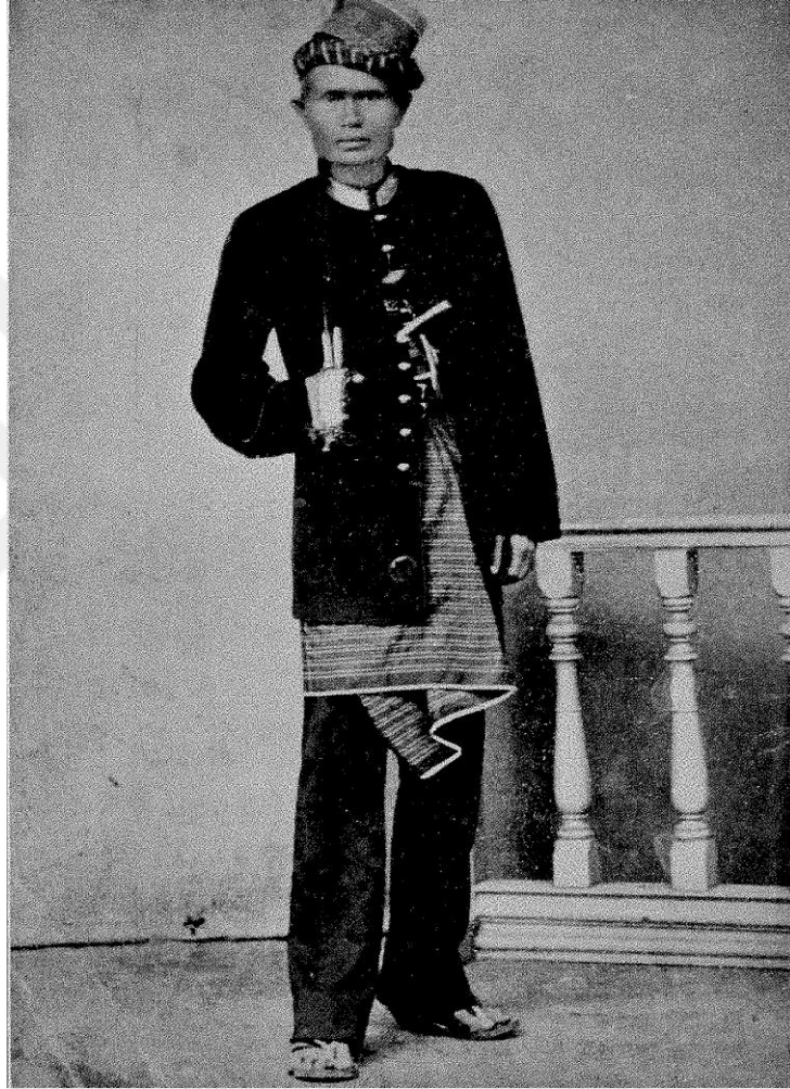
Resim 3.2: Teuku Ömer (Hurgronje, 1906a: iii)

karşı mücadele veren Teuku Ömer, Hollanda ile yaptığı anlaşma ile bir müddet Hollanda safında savaşmış olsa da bir süre sonra Hollanda ordusundan elde ettiği silahları da alarak tekrar Açe birliklerine katılmış ve Hollanda'ya karşı mücadelesine devam etmiştir. Teuku Ömer'in Hollanda birliklerini bu şekilde kandırması Hollanda'yı ağır insan ve para kaybına uğratmıştır (Siegel 2014: 33).