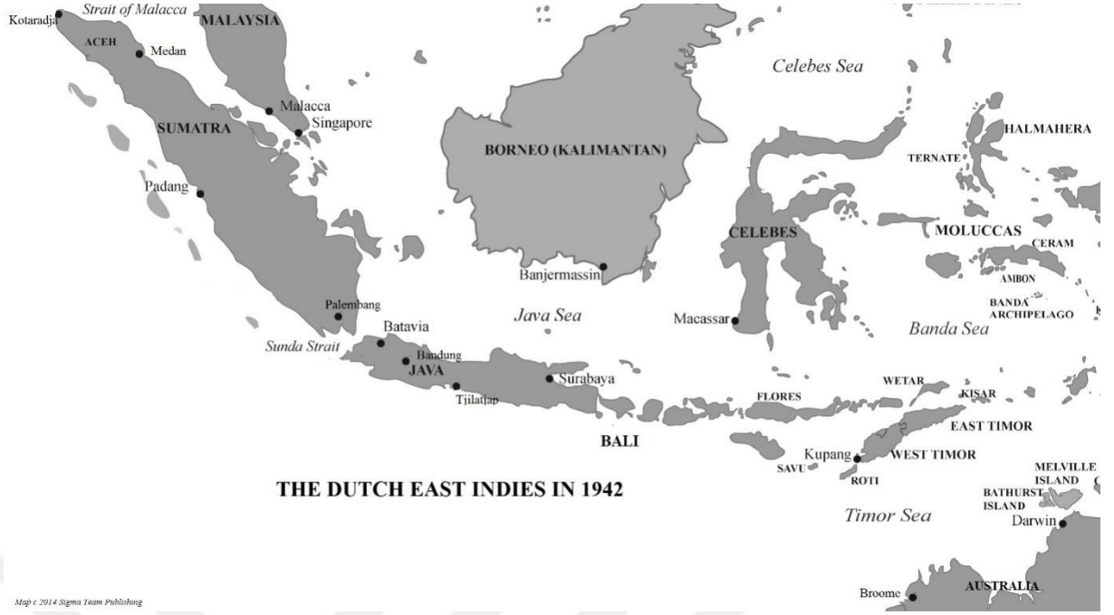
Resim 3.1: HDHA'nın 1942 Tarihli Haritası ("The Java Gold's Blog", t.y.)

18. yüzyılda İngiltere'de ortaya çıkan, zamanla diğer Avrupa ülkelerine de yayılan ve Avrupa ekonomisini şekillendiren Endüstri Devrimi (Williams, 1976: 93) ile hız kazanan Avrupa güçleri arasındaki sömürgecilik yarışı, bugünkü Avrupa devletlerini ortaya çıkaran Fransız Devrim Savaşları'ndan (1792-1802) büyük oranda etkilenmiştir. Bu süreçte Fransa'nın Hollanda'yı işgali İngiltere'nin Malaka'yı kolayca ele geçirmesini sağlarken Hollanda'nın bölgedeki üstünlüğüne de zarar vermiştir (Williams, 1976: 92). Yine Avrupa'da meydana gelen Napolyon Savaşları (1803-1815) Hollanda'nın ticarî üstünlüğünü bitirerek İngiltere'nin Hollanda nüfuzundaki topraklarda gücü eline almaya başlamasına sebep olmuştur.