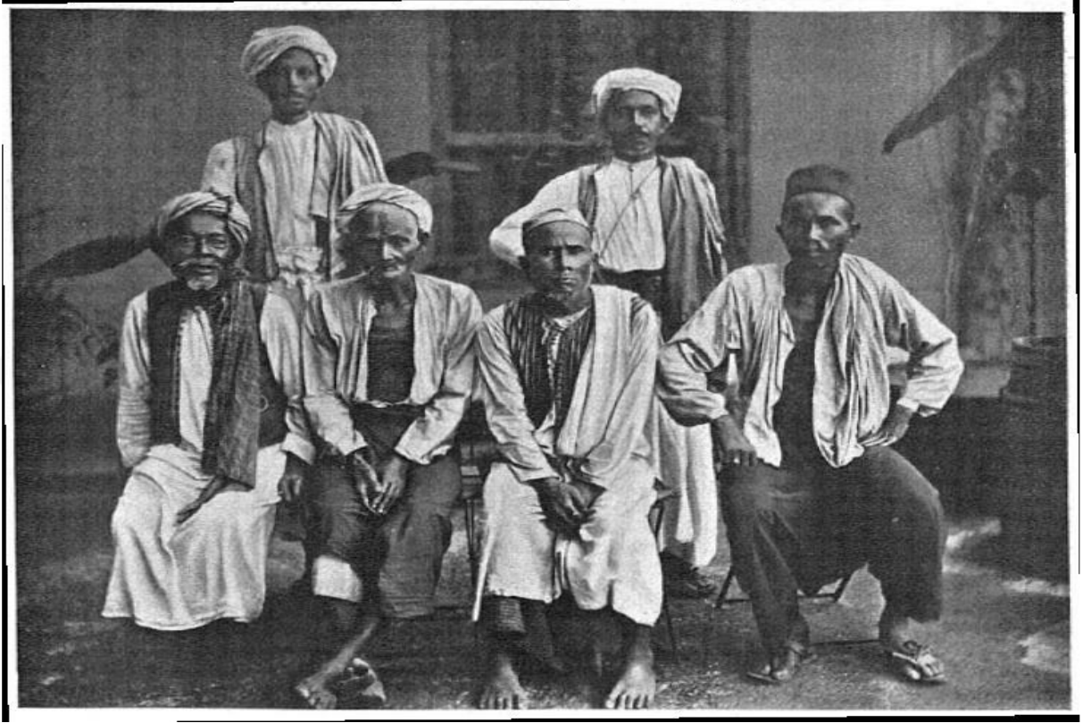
Resim 2.1: Hurgronje'nin Mekke'de fotoğrafladığı Açeli hacılar (Hurgronje, 2007:261)

dönemdeki hacıların sosyo-ekonomik-kültürel durumlarına dair de fikir vermesi bakımından da ayrı bir öneme sahiptir.