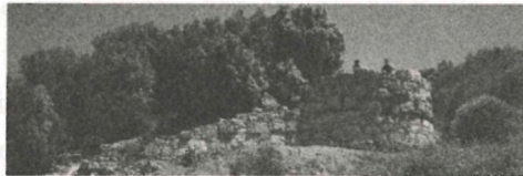
Aristoteles'in doğup büyüdüğü Stageira ören yerinde kazı etkinlikleri

Bunun yanında Aristoteles , yine, tarihte ilk kurmay yetiştiren okulun kurucusudur. Makedonya pâytahtı Pella yakınlarında Miezada , çocukluk arkadaşı hükümdar II. Filippos 'un (Φίλιππος Β' ὁ Μακεδών: 382 – 336) talebi üzerine, bahis konusu okulu kurmuş; başta müstakbel hükümdar ve Makedon ordusunun başkumandanı III. İskender 'in (356 – 323) yanısıra ona yoldaşlık edecek kurmay heyetinin diğer mensuplarını bânisi olduğu felsefe-bilime uygun tarzda yetiştirmiştir. Bunlar askerlik hünerini edinmiş hâlde tarihte savaş sanatını başlatmışlardır. Büyük İskender 'in sayıca kendininkinden katbekat üstün orduları alttirmesinin sırrı öğrenerek edinmiş olduğu savaş sanatında aranmalıdır. İskender 'den önce savaş yoktu; topluluklar –aileler, obalar, boylar– ile toplumlar –devletler– arasında kıyasıya kavgalar vardı.