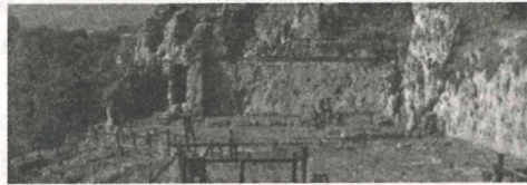
Aristoteles'in Mieza'da kurduğu askerî okuldan artakalanlar

4) Felsefe-bilimin başta gelen etkinliği olan akılyürütmenin işleyişini sağlamak üzere Aristoteles , tarihte ilk kez dilden hareketle mantığı vucuda getirmiştir. Duyular ile duygulardan tamamıyla tecrid edilmiş akılyürütmenin doğru düzgün işleyişlerine ilişkin kuralların tesbit ile tayin olundukları mantık, felsefe-bilimin öncelikle felsefe kısmının olmazsa olmazı, zorunlu ruhsatıdır. Mantığa esâslanmamış bir cümle felsefi addolunamaz. Aynı şekilde mantığın üç kolundan biri olan matematik temelli ve dilli olmayan bir ifâdenin bilimsel sayılamayacağı gibi. Bu, neden böyle? Felsefe-bilimden beklenen bilgidir de ondan. Elde edilen, ilgili ve eğitilmiş olan herkesin üstünde sallantısızca anlaşabileceği, tereddütsüzce ittifak edebileceği bilgi olmalıdır. Gündelik yaşayışımızda dayandığımız, düzayak, yalınkat düşüncelerin ürünü kendisiyle iş gördüğümüz bilgiden katlanarak düşünme ( réflexion ) sonucu kanıtlanırlığı, belgelenirliği, deneylebilirlik ile sınırlılığı hâiz felsefe-biliminki tamamıyla farklıdır. Yine gündelik yaşayışımızdakinden ayırtetmek maksadıyla felsefe-biliminkine biçimsel ( formel ) yahut biçimselleştirilmiş ( formalisé ) bilgi diyoruz.