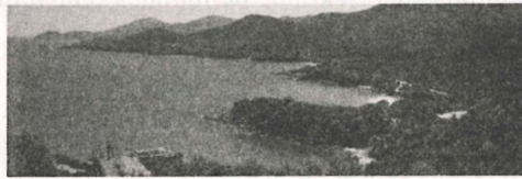
Stageira yakınlarından Ege denizi

Bilimin teori ile uygulama ikiliğine koşut biçimde Aristoteles askerlik hünerini de iki kısma ayırmıştır: Savaşın heyetiumumiyesinin en ince ayrıntılarına dek tanzimi anlamında strategya (στρατηγία) ile onun kısımlara ayrılmış uygulama bölümlerinden her biri demek olan vuruşmaların ( muharebe ) belli hedefler doğrultusunda yürütülme yönteminin tasarlanması taktik (τακτική).