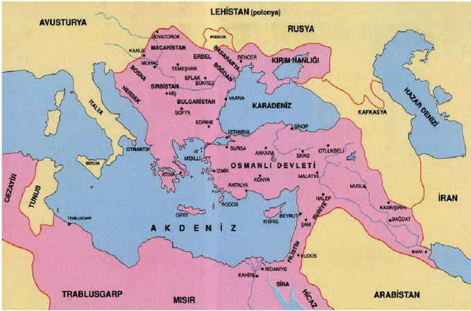
XIX. yüzyılın Başında Osmanlı Devleti'nin Üç Kıtadaki Konuşlanışını Gösterir Haritadır